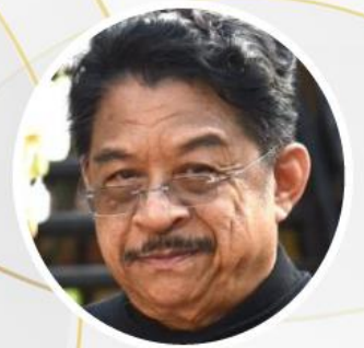
ศาสตราจารย์ริษา เทาทอง