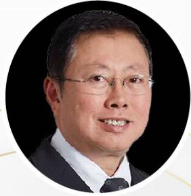
ศาสตราจารย์บวรศักดิ์ อุวรรณโณ

ID: 881 888 1118 | เวลา 09.15 น. Passcode: 2020