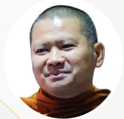
ศาสตราจารย์พระมหาพรหม ฐมมหาโล